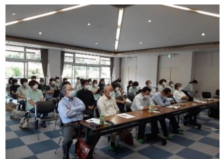
岩村工場 (岩村コミュニティセンターで開催)